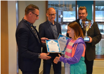
Eura | Suomen Uimaopetus ja Hengenpelastusliitto valitsi vuoden 2019 vesiliikuntapaikaksi Euran uimahallin.

2.12.2019 15.32, URHEILU @Tilaaajalle Euran uimahallista vuoden vesiliikuntapaikka